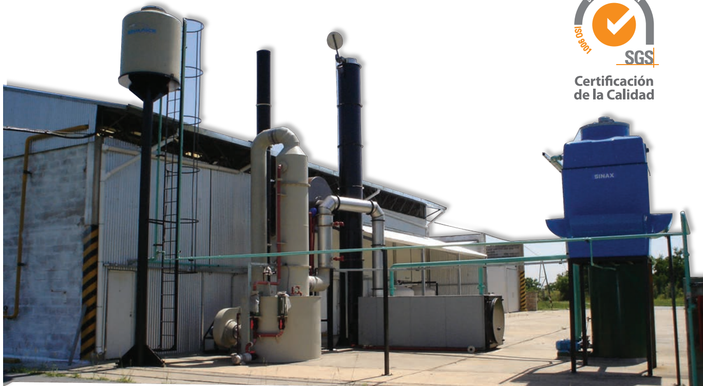
(2) Sistema de tratamiento de gases por vía húmeda con intercambiador de calor, quenche y scrubber.